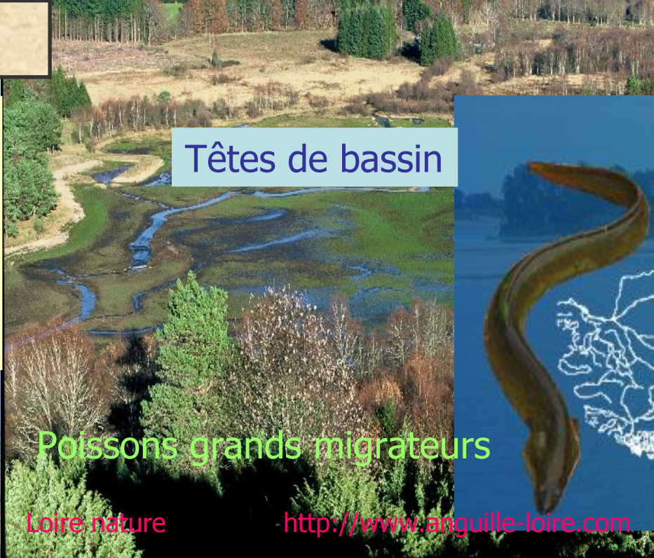
Têtes de bassin